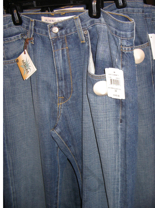
विकासशील देशों में उत्पादित जीन्स अमेरिका में 6500 रु. में बेची जा रही हैं।

बहुराष्ट्रीय कंपनियाँ एक अन्य तरीके से उत्पादन नियंत्रित करती हैं। विकसित देशों की बड़ी बहुराष्ट्रीय कंपनियाँ छोटे उत्पादकों को उत्पादन का ऑर्डर देती हैं। वस्त्र, जूते-चप्पल एवं खेल के सामान ऐसे उद्योग हैं, जहाँ विश्वभर में बड़ी संख्या में