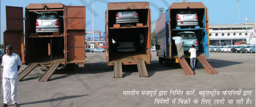
भारतीय मजदूरों द्वारा निर्मित कारें, बहुराष्ट्रीय कंपनियों द्वारा विदेशों में बिक्री के लिए लादी जा रही हैं।