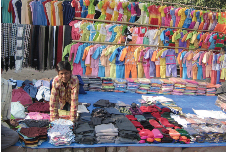
सिलेसिलाए वस्त्रों के छोटे व्यापारी बहुराष्ट्रीय कंपनियों के ब्रांड और आयात दोनों से कड़ी प्रतिस्पर्धा का सामना करते हुए।

सामान्यतः व्यापार के खुलने से वस्तुओं का एक बाज़ार से दूसरे बाज़ार में आवागमन होता है। बाज़ार में वस्तुओं के विकल्प बढ़ जाते हैं। दो बाज़ारों में एक ही वस्तु का मूल्य एक समान होने लगता है। अब दो देशों के उत्पादक एक दूसरे से हजारों मील दूर होकर भी एक दूसरे से प्रतिस्पर्धा कर सकते हैं। इस प्रकार, विदेश व्यापार विभिन्न देशों के बाज़ारों को जोड़ने या एकीकरण में सहायक होता है।