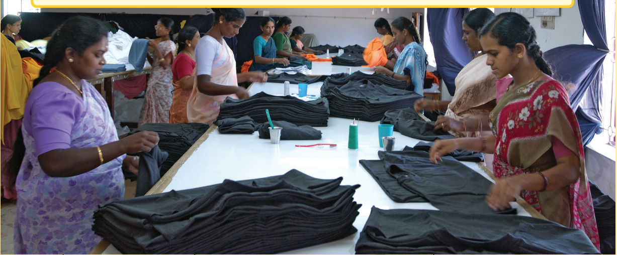
वस्त्र निर्यातक फैक्ट्री में महिला श्रमिक – यद्यपि वैश्वीकरण ने महिलाओं को काम के लिए अवसर प्रदान किया है, परन्तु रोज़गार की स्थितियाँ यह प्रदर्शित करती हैं कि महिलाओं को लाभ में भागीदारी समुचित रूप से नहीं मिली।

अब हम देखते हैं कि भारत में वस्त्र निर्यात उद्योग प्रतिस्पर्धा के दबाव को कैसे सहन कर रहे हैं?