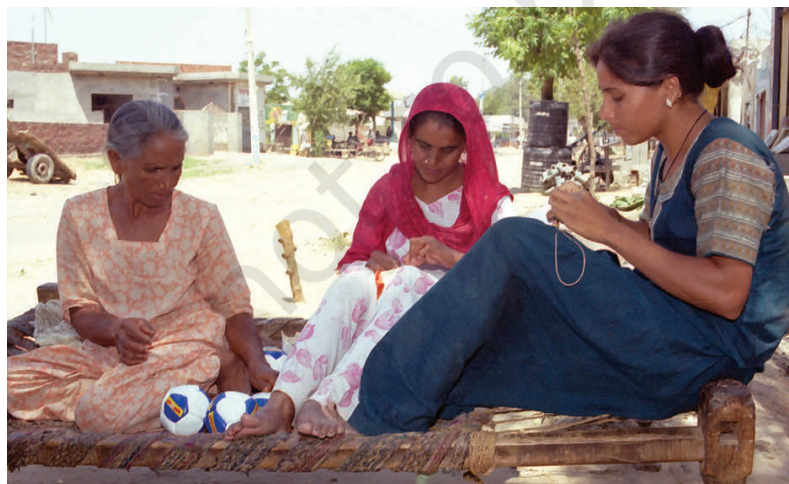
लुधियाना के एक घर में एक बड़ी बहुराष्ट्रीय कंपनी के लिए फुटबाल-निर्माण का चित्र

इस प्रकार, हम देखते हैं कि बहुराष्ट्रीय कंपनियाँ कई तरह से अपने उत्पादन कार्य का प्रसार कर रही हैं और विश्व के कई देशों की स्थानीय कंपनियों के साथ पारस्परिक संबंध स्थापित कर रही हैं। स्थानीय कंपनियों के साथ साझेदारी द्वारा, आपूर्ति के लिए स्थानीय कंपनियों का इस्तेमाल करके और स्थानीय कंपनियों से निकट प्रतिस्पर्धा करके अथवा उन्हें खरीद कर बहुराष्ट्रीय कंपनियाँ दूरस्थ स्थानों के उत्पादन पर अपना प्रभाव जमा रही हैं। परिणामतः दूर-दूर स्थानों पर फैला उत्पादन परस्पर संबंधित हो रहा है।