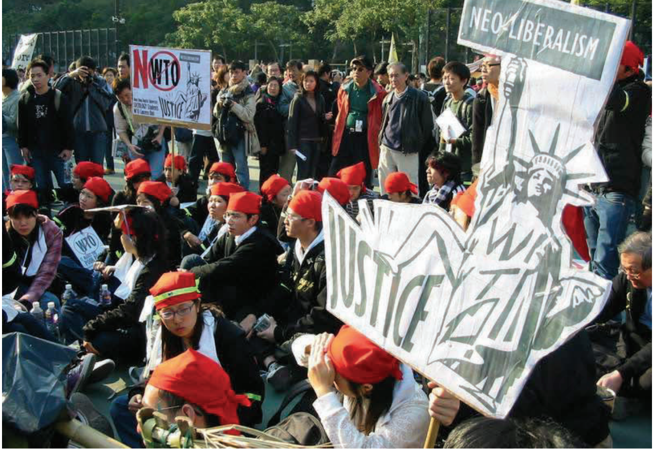
हांगकांग में डब्ल्यू.टी.ओ. के खिलाफ प्रदर्शन-2005