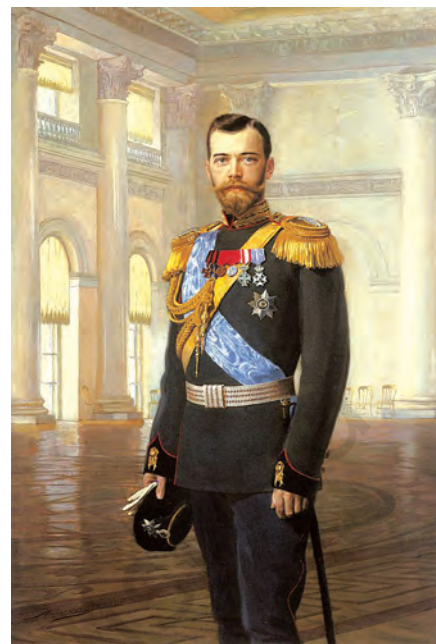
चित्र 3 - सेंट पीटर्सबर्ग स्थित विंटर पैलेस के व्हाइट हॉल में ज़ार निकोलस II, 1900.

1914 में रूस और उसके पूरे साम्राज्य पर ज़ार निकोलस II का शासन था। मास्को के आसपास पड़ने वाले भूक्षेत्र के अलावा आज का फ़िनलैंड, लातविया, लिथुआनिया, एस्तोनिया तथा पोलैंड, यूक्रेन व बेलारूस के कुछ हिस्से रूसी साम्राज्य के अंग थे। यह साम्राज्य प्रशांत महासागर तक फैला हुआ था और आज के मध्य एशियाई राज्यों के साथ-साथ जॉर्जिया, आर्मेनिया व अज़रबैजान भी इसी साम्राज्य के अंतर्गत आते थे। रूस में ग्रीक ऑर्थोडॉक्स चर्च से उपजी शाखा रूसी ऑर्थोडॉक्स क्रिश्चियैनिटी को मानने वाले बहुमत