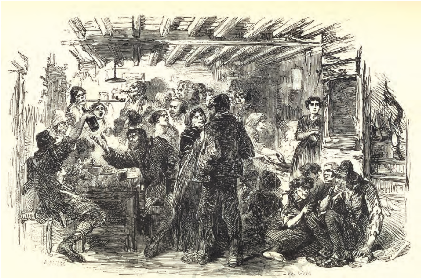
चित्र 1 - उन्नीसवीं शताब्दी के मध्य में लंदन के गरीबों की दशा उसी समय के एक व्यक्ति की दृष्टि से.

स्रोत : हेनरी मेह्यू, लंदन लेबर ऐन्ड लंदन पुअर, 1861