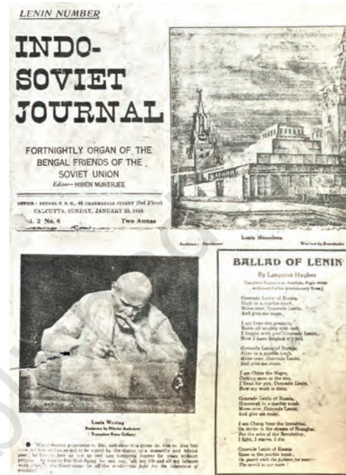
चित्र 20 - इंडो-सोवियत जर्नल का लेनिन विशेषांक। दूसरे विश्वयुद्ध के दौरान भारतीय कम्युनिस्टों ने सोवियत संघ के लिए जनमत निर्माण किया।