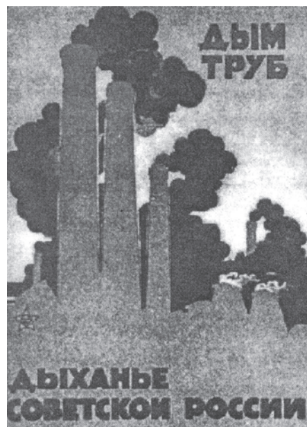
चित्र 14 - कारखानों को समाजवाद के प्रतीक की तरह माना जाता था. पोस्टर में लिखा है: 'चिमनियों से निकलता धुआँ ही सोवियत रूस की साँस है।'