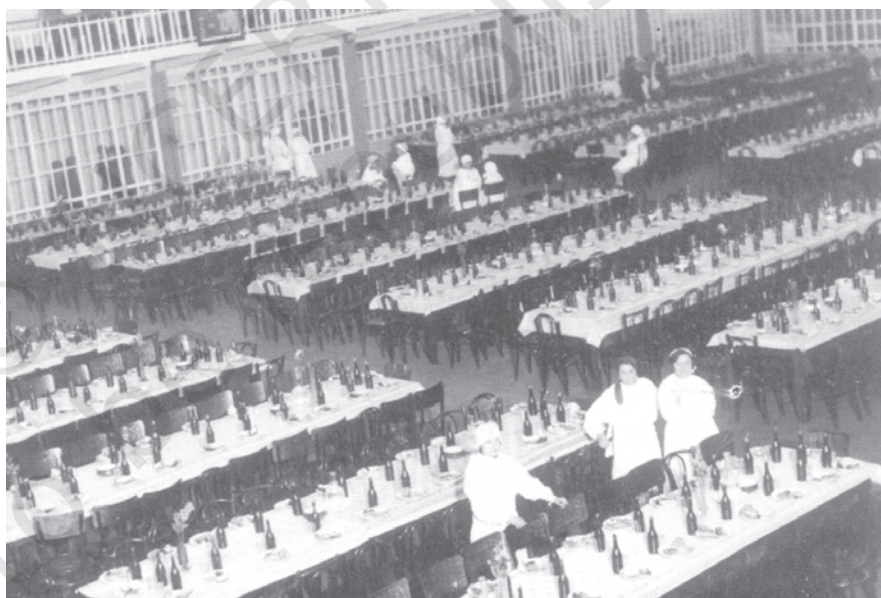
चित्र 17 - तीस के दशक में एक कारखाने का भोजन कक्ष.