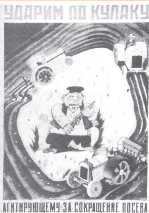
चित्र 18 - सामूहिकीकरण के दौर का एक पोस्टर.

वी. सोकोलोव (सं.), ऑब्ज़ाचेस्त्वो / व्लास्त, वी 1930-ये गोदी (मास्को, 1997)।