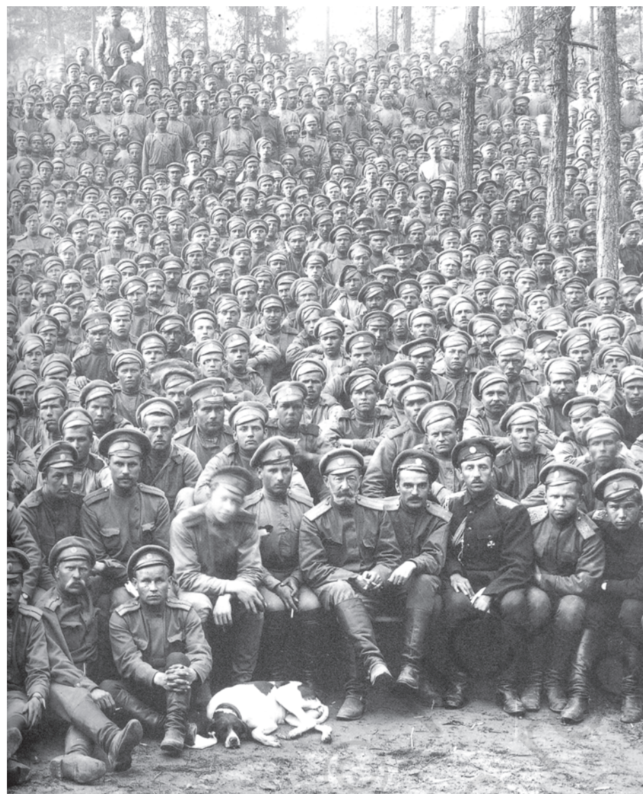
चित्र 7 - पहले विश्वयुद्ध के दौरान रूसी सिपाही . शाही रूसी सेना को 'रूसी स्टीमरोलर' कहा जाता था। यह दुनिया की सबसे बड़ी सशस्त्र सेना थी। जब इस सेना ने अपनी निष्ठा बदल कर क्रांतिकारियों को समर्थन देना शुरू कर दिया तो जार की सत्ता भी ढह गई।

युद्ध से उद्योगों पर भी बुरा असर पड़ा। रूस के अपने उद्योग तो वैसे भी बहुत कम थे, अब तो बाहर से मिलने वाली आपूर्ति भी बंद हो गई क्योंकि बाल्टिक समुद्र में जिस रास्ते से विदेशी औद्योगिक सामान आते थे उस पर जर्मनी का कब्जा हो चुका था। यूरोप के बाकी देशों के मुकाबले रूस के औद्योगिक उपकरण ज़्यादा तेजी से बेकार होने लगे। 1916 तक रेलवे लाइनें टूटने लगीं। अच्छी सेहत वाले मर्दों को युद्ध में झोंक दिया गया। देश भर में मज़दूरों की कमी पड़ने लगी और ज़रूरी सामान बनाने वाली छोटी-छोटी वर्कशॉप्स ठप्प होने लगीं। ज़्यादातर अनाज सैनिकों का पेट भरने के लिए मोर्चे पर भेजा जाने लगा। शहरों में रहने वालों के लिए रोटी और आटे की किल्लत पैदा हो गई। 1916 की सर्दियों में रोटी की दुकानों पर अकसर दंगे होने लगे।