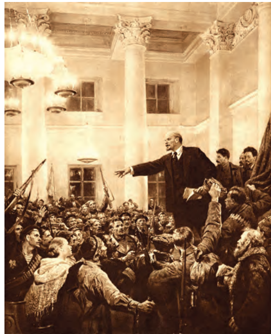
चित्र 9 - अप्रैल 1917 में मज़दूरों को संबोधित करते लेनिन की एक बोल्शेविक छवि.

गांवों में किसान और उनके समाजवादी क्रांतिकारी नेता भूमि पुनर्वितरण के लिए दबाव डालने लगे थे। इस काम के लिए भूमि समितियाँ बना दी गई थीं। सामाजिक क्रांतिकारियों से प्रेरणा और प्रोत्साहन लेते हुए जुलाई से सितंबर के बीच किसानों ने बहुत सारी ज़मीन पर कब्ज़ा कर लिया।