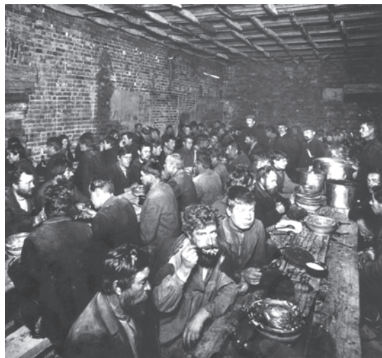
चित्र 5 - युद्ध से पहले सेंट पीटर्सबर्ग में बेरोज़गार किसान, बहुत सारे लोग धर्मार्थ लंगरों में खाना खाते थे और खस्ताहाल मकानों में रहते थे।

सामाजिक स्तर पर मजदूर बँटे हुए थे। कुछ मजदूर अपने मूल गाँवों के साथ अभी भी गहरे संबंध बनाए हुए थे। बहुत सारे मजदूर स्थायी रूप से शहरों में ही बस चुके थे। उनके बीच योग्यता और दक्षता के स्तर पर भी काफी फ़र्क था। सेंट पीटर्सबर्ग के एक धातु मजदूर ने कहा था : 'धातुकर्मी मजदूरों में खुद को साहब मानते थे। उनके काम में ज्यादा प्रशिक्षण और निपुणता की ज़रूरत जो रहती थी...'। 1914 में फैक्ट्री मजदूरों में औरतों की संख्या 31 प्रतिशत थी लेकिन उन्हें पुरुष मजदूरों के मुकाबले कम वेतन मिलता था (मर्दों की तनख्वाह के मुकाबले आधे से तीन-चौथाई तक)। मजदूरों के बीच मौजूद फ़ासला उनके पहनावे और व्यवहार में भी साफ़ दिखाई देता था। यद्यपि कुछ मजदूरों ने बेरोज़गारी या आर्थिक संकट के समय एक-दूसरे की मदद करने के लिए संगठन बना लिए थे लेकिन ऐसे संगठन बहुत कम थे।