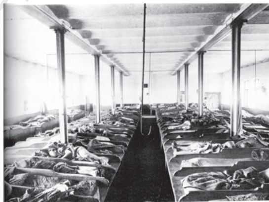
चित्र 6 - क्रांति-पूर्व रूस में एक डॉर्मिटरी में बने बंकर में सोते मजदूर. वे पालियों में बारी-बारी से सोते थे और परिवार को साथ नहीं रख सकते थे।