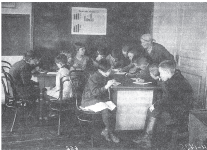
चित्र 15 - तीस के दशक में सोवियत रूस के एक स्कूल में पढ़ते बच्चे. बच्चे सोवियत अर्थव्यवस्था का अध्ययन कर रहे हैं।