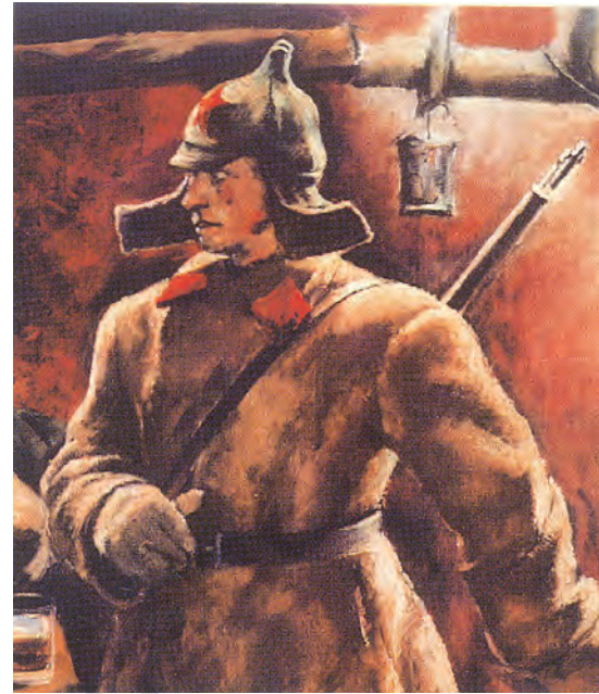
चित्र 12 - सोवियत टोपी (बुदियोनोव्का) पहने एक सिपाही.

बोलशेविक पार्टी का नाम बदल कर रूसी कम्युनिस्ट पार्टी (बोलशेविक) रख दिया गया। नवंबर 1917 में बोलशेविकों ने संविधान सभा के लिए चुनाव कराए लेकिन इन चुनावों में उन्हें बहुमत नहीं मिल पाया। जनवरी 1918 में असेंबली ने बोलशेविकों के प्रस्तावों को खारिज कर दिया और लेनिन ने असेंबली बर्खास्त कर दी। उनका मत था कि अनिश्चित परिस्थितियों में चुनी गई असेंबली के मुकाबले अखिल रूसी सोवियत कांग्रेस कहीं ज़्यादा लोकतांत्रिक संस्था है। मार्च 1918 में अन्य राजनीतिक सहयोगियों की असहमति के बावजूद बोलशेविकों ने ब्रेस्ट लिटोव्स्क में जर्मनी से संधि कर ली। आने वाले सालों में बोलशेविक पार्टी अखिल रूसी सोवियत कांग्रेस के लिए होने वाले चुनावों में हिस्सा लेने वाली एकमात्र पार्टी रह गई। अखिल रूसी सोवियत कांग्रेस को अब देश की संसद का दर्जा दे दिया गया था। रूस एक-दलीय राजनीतिक व्यवस्था वाला देश बन गया। ट्रेड यूनियनों पर पार्टी का नियंत्रण रहता था। गुप्तचर पुलिस (जिसे पहले चेका और बाद में ओजीपीयू तथा एनकेवीडी का नाम दिया गया) बोलशेविकों की आलोचना करने वालों को दंडित करती थी। बहुत सारे युवा लेखक और कलाकार भी पार्टी की तरफ़ आकर्षित हुए क्योंकि वह समाजवाद और परिवर्तन के प्रति समर्पित थी। अक्टूबर 1917 के बाद ऐसे कलाकारों और लेखकों ने कला और वास्तुशिल्प के क्षेत्र में नए प्रयोग शुरू किए। लेकिन पार्टी द्वारा थोपी गई सेंसरशिप के कारण बहुत सारे लोगों का पार्टी से मोह भंग भी होने लगा था।