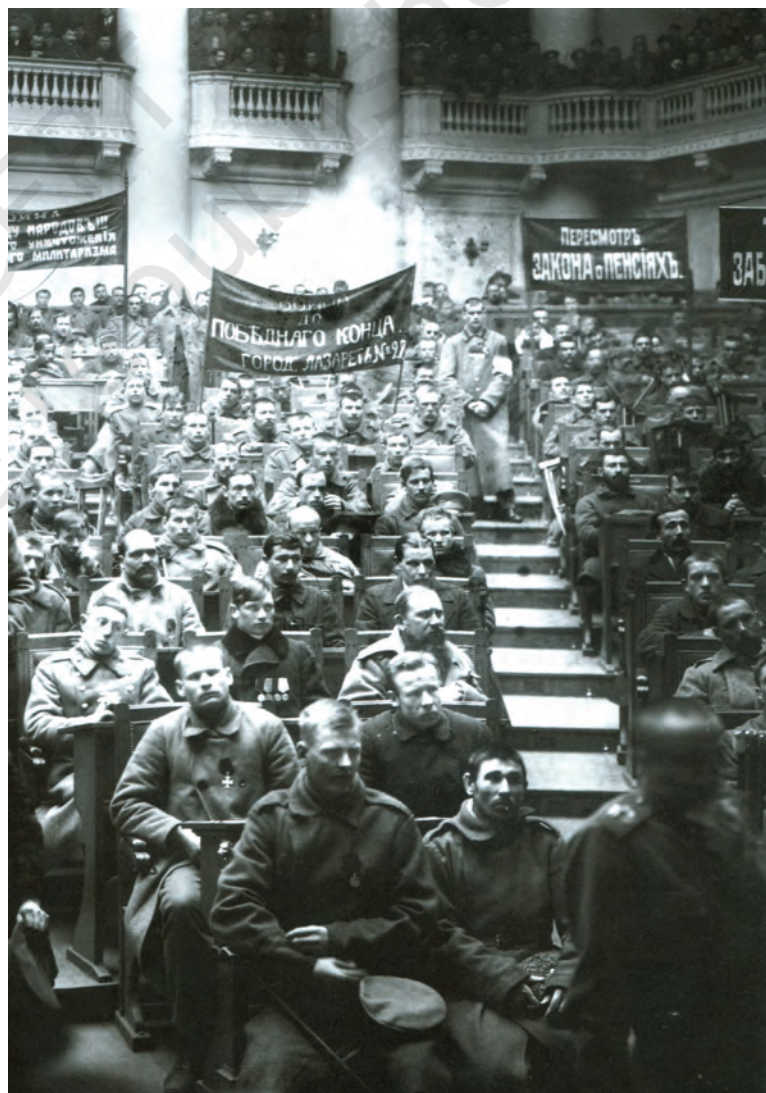
चित्र 8 - ड्यूमा में पेत्रोग्राद सोवियत की बैठक, फरवरी 1917.

बॉक्स 2 देखें और वर्तमान कैलेंडर के हिसाब से अंतर्राष्ट्रीय महिला दिवस की तिथि का पता लगाएँ।