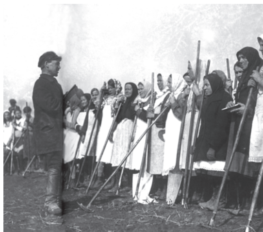
चित्र 19 - विशाल सामूहिक फ़ार्मों में काम करने के लिए जुटी किसान औरतें.

वी. सोकोलोव (सं.), ऑब्शचेस्त्वो I क्लास्त, वी 1930-ये गोदी।