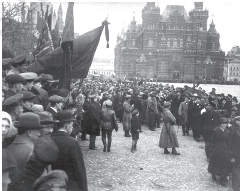
चित्र 13 - मास्को में मई दिवस का प्रदर्शन, 1918.