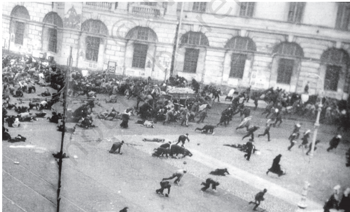
चित्र 10 - जुलाई के दिन.

17 जुलाई 1917 को बोल्शेविक समर्थक प्रदर्शनकारियों पर सेना द्वारा गोलीबारी का दृश्य।