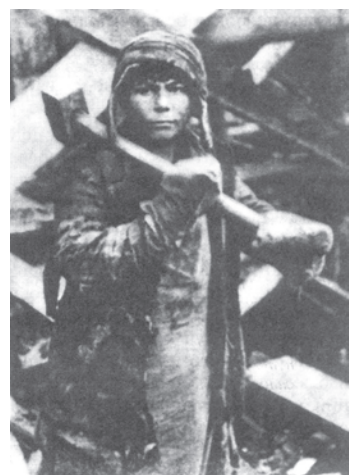
चित्र 16 - पहली पंचवर्षीय योजना के दौरान मैग्नीटोगोर्स्क का एक बच्चा. यह बच्चा सोवियत रूस के लिए काम कर रहा है।